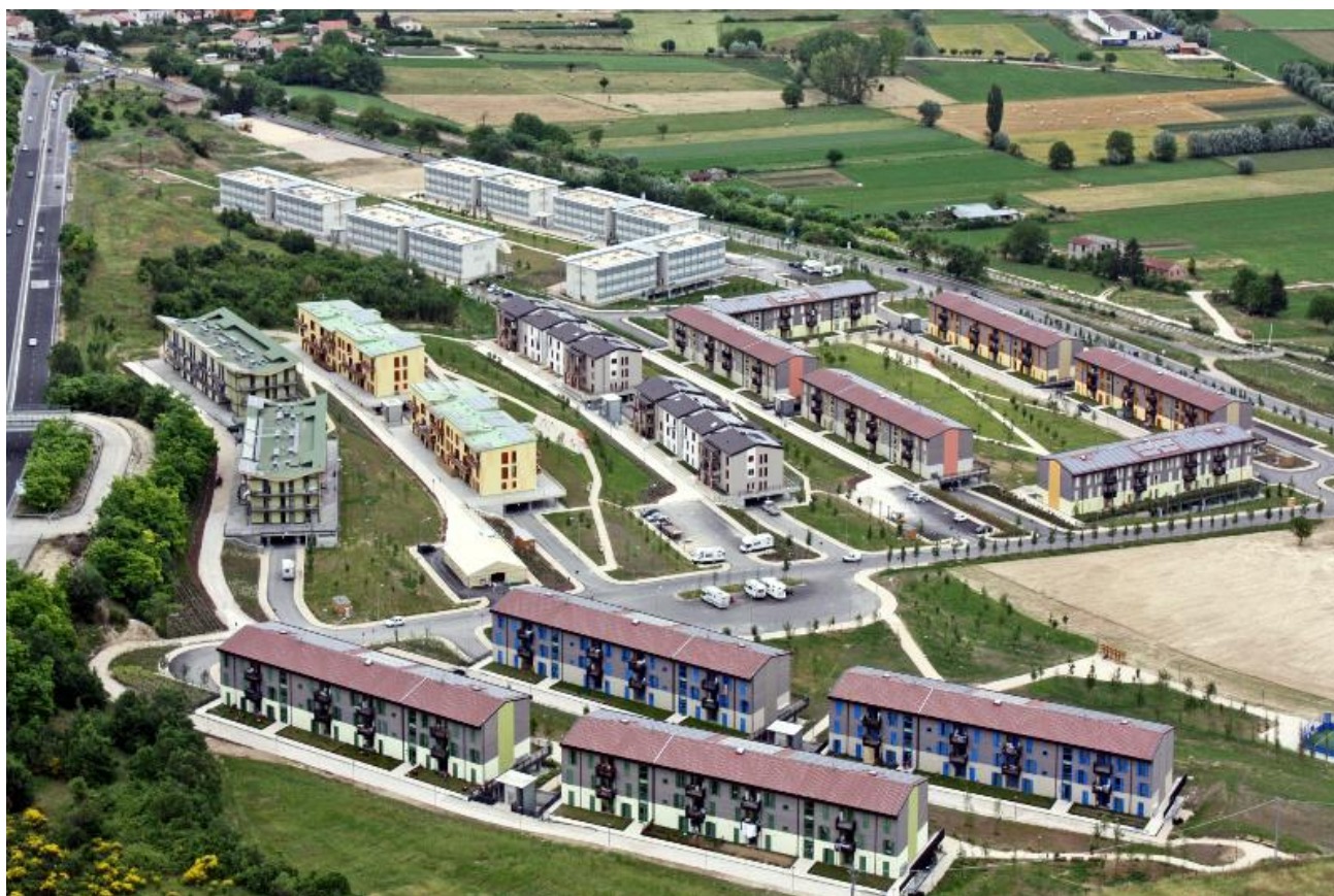
Figura 1 - Insediamento progetto CASE di Bazzano

Gli stessi, come sopra distinti, contano una capienza massima di 15.195 inquilini relativamente al progetto CASE e di 4291 per quanto concerne i MAP, per una capienza totale di 19.486 abitanti .