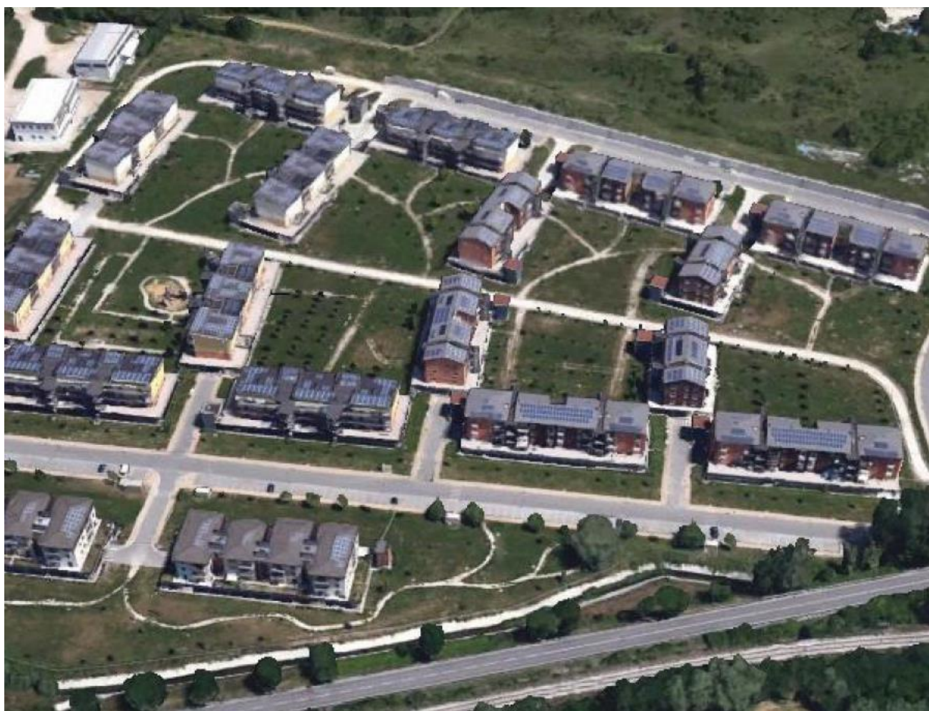
Figura 3 - Insediamento progetto CASE di Sassa NSI