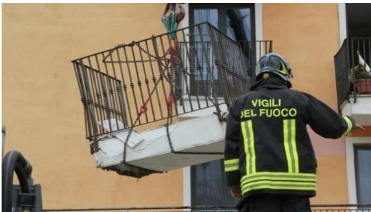
Figura 2 – Cedimento balconi progetto CASE di Cese di Preturo

Complessivamente risultano 925 alloggi inagibili riferiti al progetto CASE e ulteriori 185 relativi ai MAP per un totale di 1.110 alloggi inagibili .